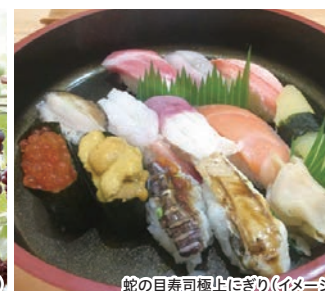
蛇の目寿司極上にぎり(イメージ)