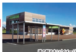
道の駅るもい(イメージ)