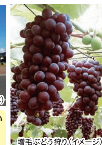
増毛ぶどう狩り(イメージ)