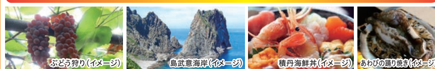
ぶどう狩り(イメージ)