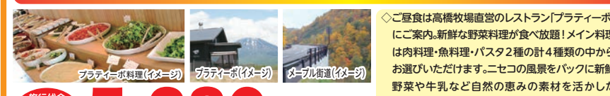
プラティーポ料理(イメージ)