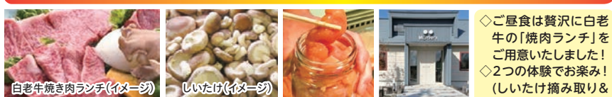
白老牛焼肉ランチ(イメージ)